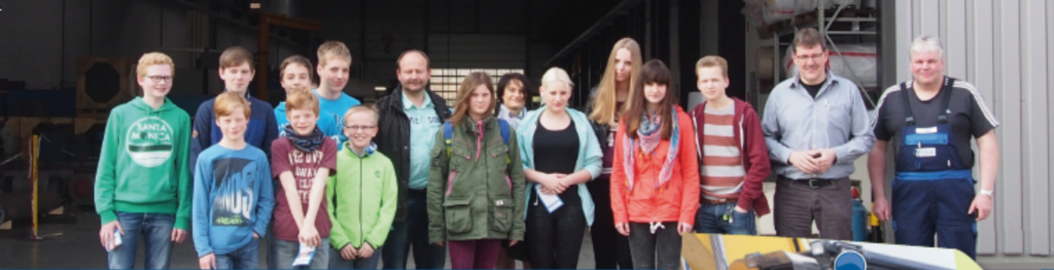
► Schülerinnen und Schüler aus den Jahren 2014 und 2015