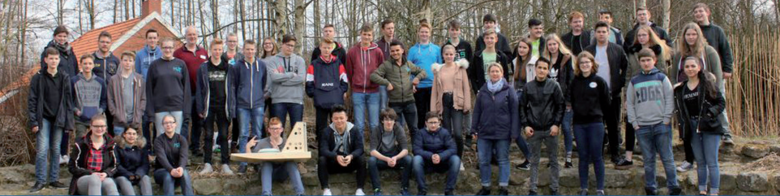
► Schülerinnen und Schüler aus dem Jahr 2018