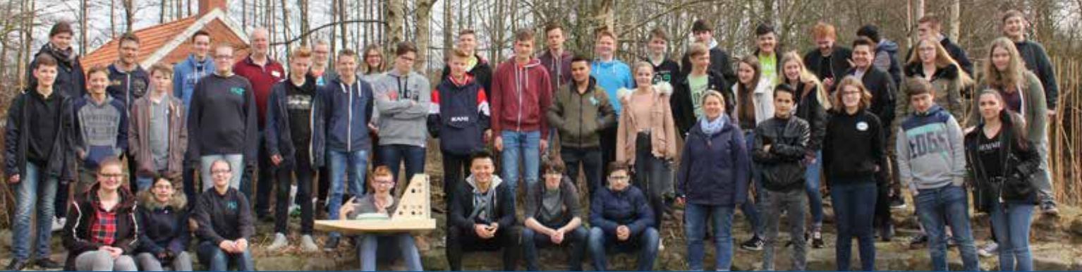
► Schülerinnen und Schüler aus dem Jahr 2018